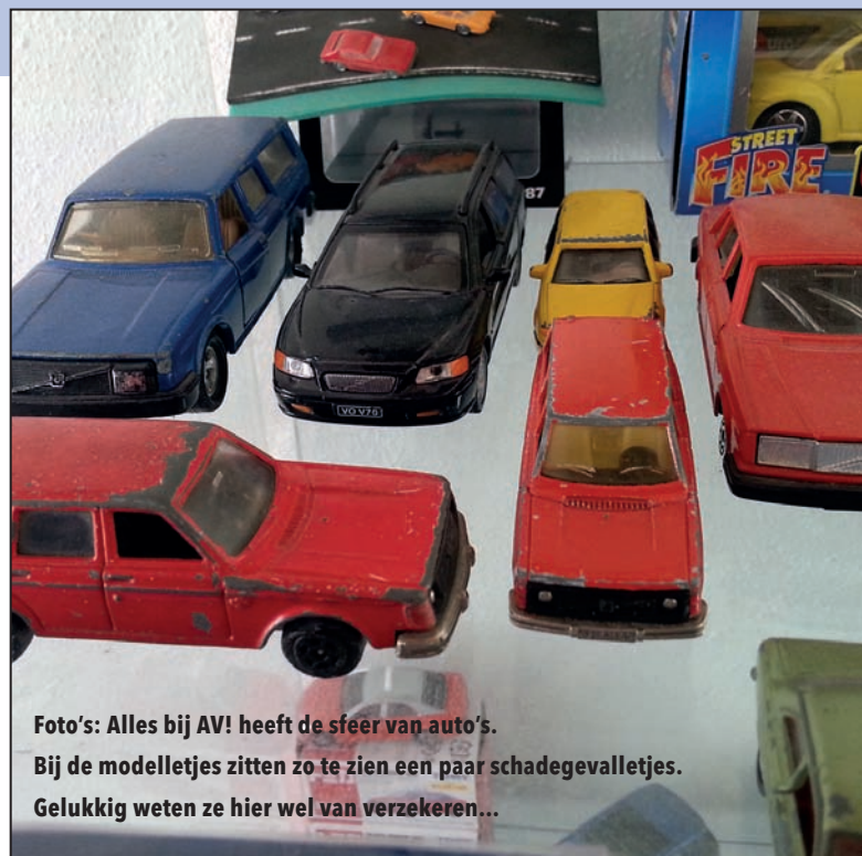
Foto's: Alles bij AV! heeft de sfeer van auto's. Bij de modelletjes zitten zo te zien een paar schadegevalletjes. Gelukkig weten ze hier wel van verzekeren...